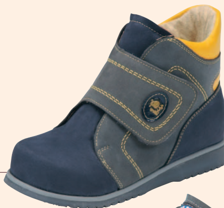
GALAXY Größe 23-35 5.7006 Weite 4 grau/silber Nubuk/Nylotex