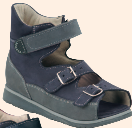
ATLANTIS Größe 23-35 5.7000 Weite 4 dunkelblau/grau Nubuk