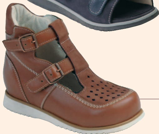
PHOENIX Größe 23-35 5.7016 Weite 4 sattelbraun/zigarre Nappa/Nubuk