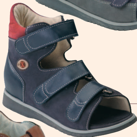
MOSKITO Größe 23-35 5.7014 Weite 4 dunkelblau/dunkelblau/rot Nubuk/Nappa/Nubuk